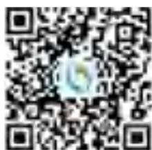
威海バスグループの WeChat 公式アカウント

199号線内のバス路線に関するお問い合わせは、 https://weihai.8684.cn または、0631-5230950 威海市バスグループまでお電話いただくか、下記のQRコードをスキャンして情報をお読み下さい。