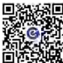
威海交運公共交通公司の WeChat 公式アカウント

200以上のバス路線については、0631-6079607 威海交運公共交通有限公司に電話するか、下記のQRコードを読み取って「威海交運公共交通公司」をフォローしてください。