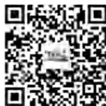
中国鉄道公式 アカウント