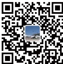
威海国际机场微信公众号