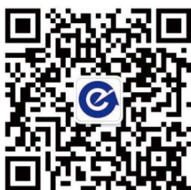
威海交运公交公司公众号

200 路以上公交线路查询，请致电 0631-6079607 威海交运公共交通有限公司咨询或扫描下方二维码关注“威海交运公交公司”公众号查询。