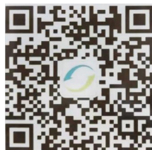
威海公共交通集团巴士有限公司公众号

具体查询巴士实时位置、发车时刻及购票请关注微信公众号“威海公共交通集团巴士有限公司”或扫描下方二维码。