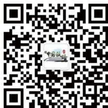
中国铁路官方微信